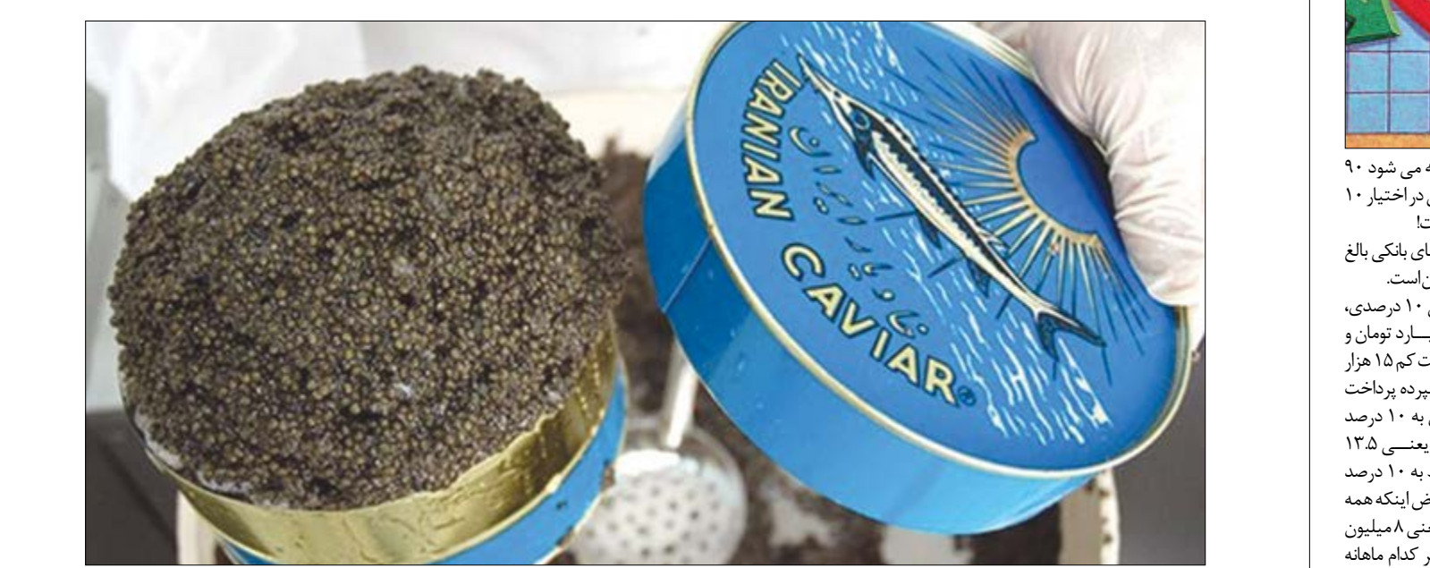
گروه بازرگانی کویر مرنجاب

کمک به شناسایی بازار فروش برای خاویار تولیدی، از سوی دستگاه‌های ذی‌ربط ضرورت دارد