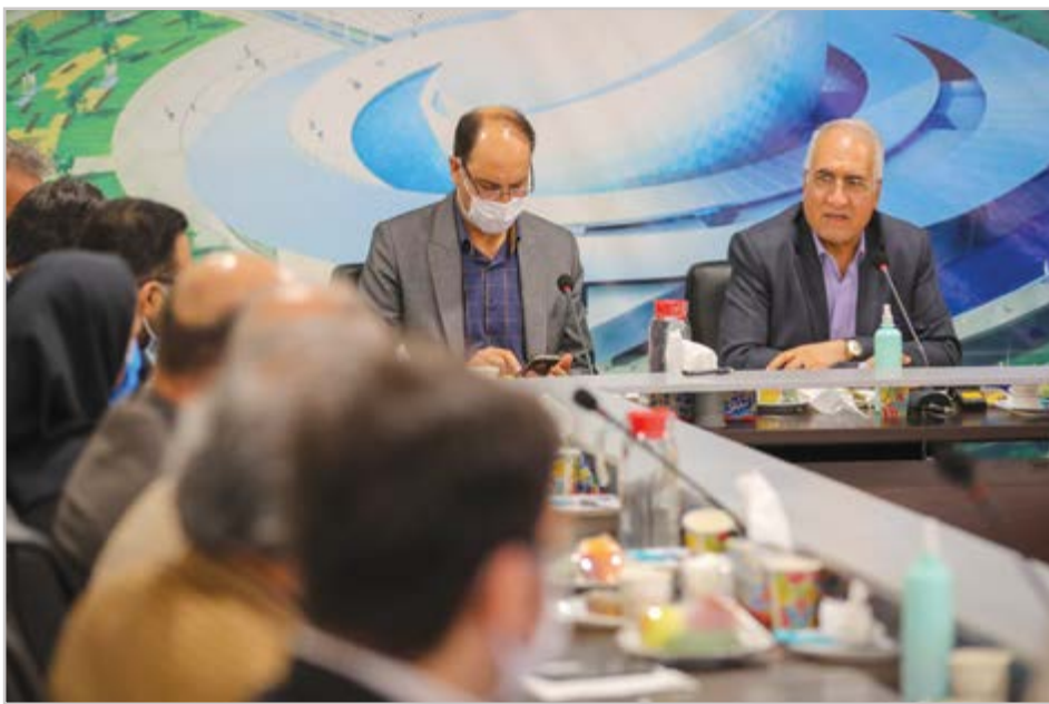
گروه شهری گزارش

نوروزی: ورود به پروژه هادر راستای عدالت فضایی و توسعه پایدار شهر اصفهان است