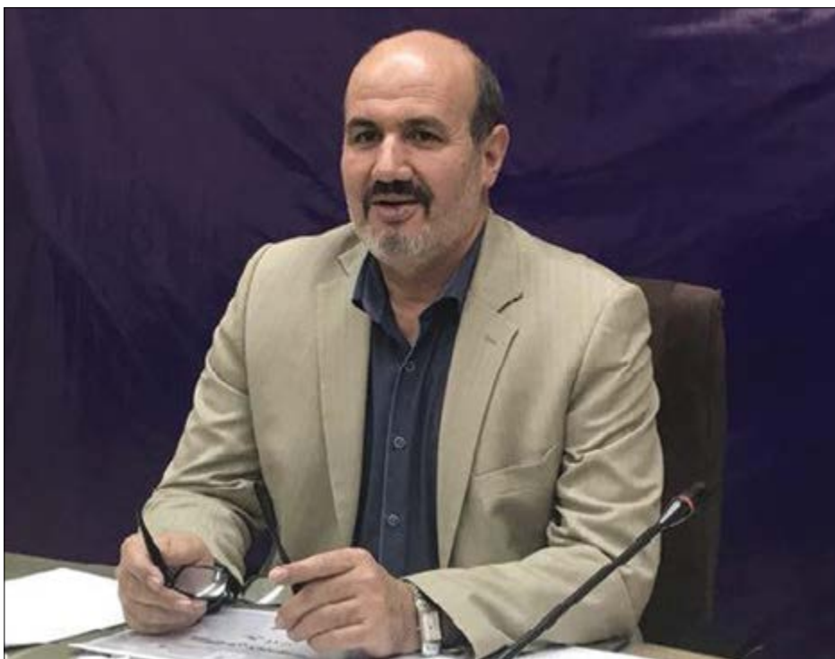
گروه بازرگانی گفت و گو

اقدامات و سوءاستفاده نوسان گیران را نباید به نام دولت نوشت