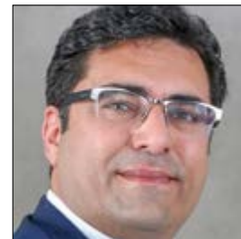
دکتر مجید کریم ساجی / دبیر کل مرکز تجارت بین الملل سازمان همکاری های اسلامی در غرب آسیا

امروزه ارایه خدمات فنی و مهندسی، یکی از ارکان و عوامل تأثیرگذار و قدرتمند در توسعه اقتصادی کشورها بوده و پارافراتر از مرزهای جغرافیایی کشورها گذشته، با سرعت در حال توسعه و گسترش در سطح بین المللی می باشد. بر اساس ماده یک آیین نامه اجرایی حمایت های دولت از صادرات کنندگان خدمات فنی و مهندسی صادرات خدمات فنی و مهندسی عبارتست از صادرات فعالیت های هدفدار مهندسی، تدارکات، طراحی، اجرا، ساخت، تعمیر کالاهای تجهیزات و ماشین آلات صنعتی، نصب، راه اندازی، نظارت و آموزش های مرتبط، انتقال دانش فنی، فعالیت های نرم افزار (مدیریت، طراحی، مشاوره، خدمات انفورماتیک)، مطالعه توسعه و نظایر آنها به نحوی که صدور کالای مصرف محسوب نشود